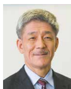
水野 敏樹 教授