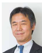
澤本 伸克 教授