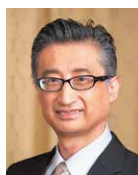
望月 秀樹 教授